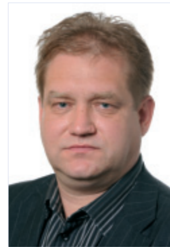
Ivari PADAR SDE / S&D (s. 1965)

Majandus- ja rahanduskomisjoni liige Tööstuse, teadusuuringute ja energeetika-komisjoni asendusliige