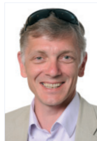
Indrek TARAND GREENS / EFA (s. 1964)

Kõik Euroopa Parlamendi istungid on avalikud ning dokumendid avaldatakse Euroopa Liidu 23 keeles, sealhulgas eesti keeles. Internetis on materjalid kättesaadavad aadressilt: www.europarl.europa.eu