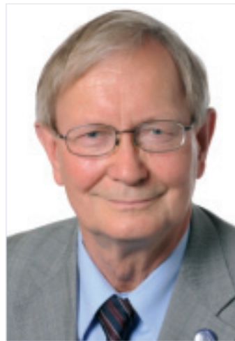
Tunne KELAM IRL / EPP (s. 1936)

Väliskomisjoni liige Kaitse ja julgeoleku allkomisjoni liige Tööhõive- ja sotsiaalkomisjoni asendusliige