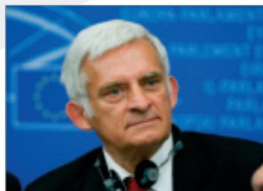
EP president Jerzy Buzek.

Aastate jooksul on Euroopa Parlamendi tähtsus ja mõjuvõim kasvanud. Seda kinnitavad nii Maastrichti (1993), Amsterdami (1999) kui ka Nizza (2003) lepingud. Kui jõustub Lissaboni leping, annab see parlamendile täiendavalt võimu ning lisab selgust Euroopa Liidu toimimise põhimõtetele.